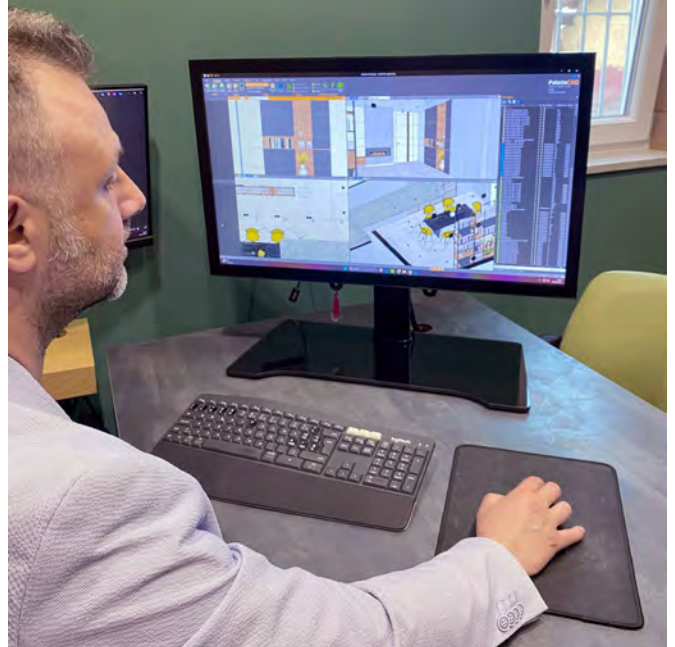
Visualisaties ondersteunen niet alleen klanten, maar optimaliseren ook de samenwerking binnen het team en met partners.