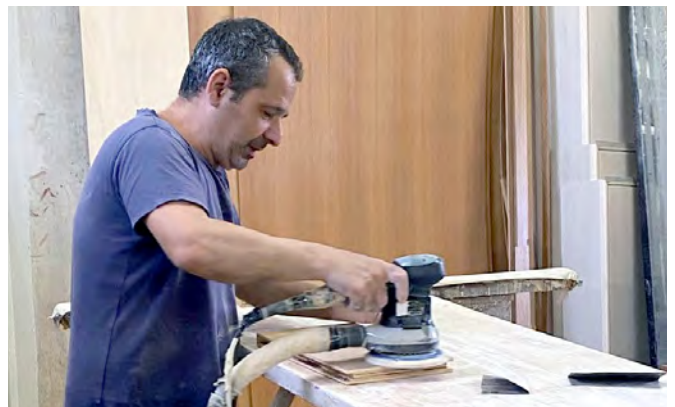
Van digitaal ontwerp naar maatwerkproductie.

Voorheen werkte Target Home met schetsen, inspiratiebeelden en handgeschreven notities. Een combinatie die in de communicatie met klanten en partners vaak haar grenzen bereikte. Vooral wanneer klanten hun ideeën niet exact konden verwoorden, was het lastig om een gezamenlijke visuele taal te vinden. „We wisten dat we onze processen moesten verbeteren om aan de verwachtingen van onze klanten te voldoen, maar lange tijd hadden we daarvoor niet het juiste hulpmiddel.” – Salvo Romano, hoofd verkoop en planning