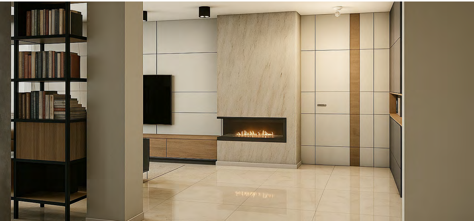
Ruimtes met impact: Target Home verbindt emotie en helderheid, ontworpen met Palette CAD.