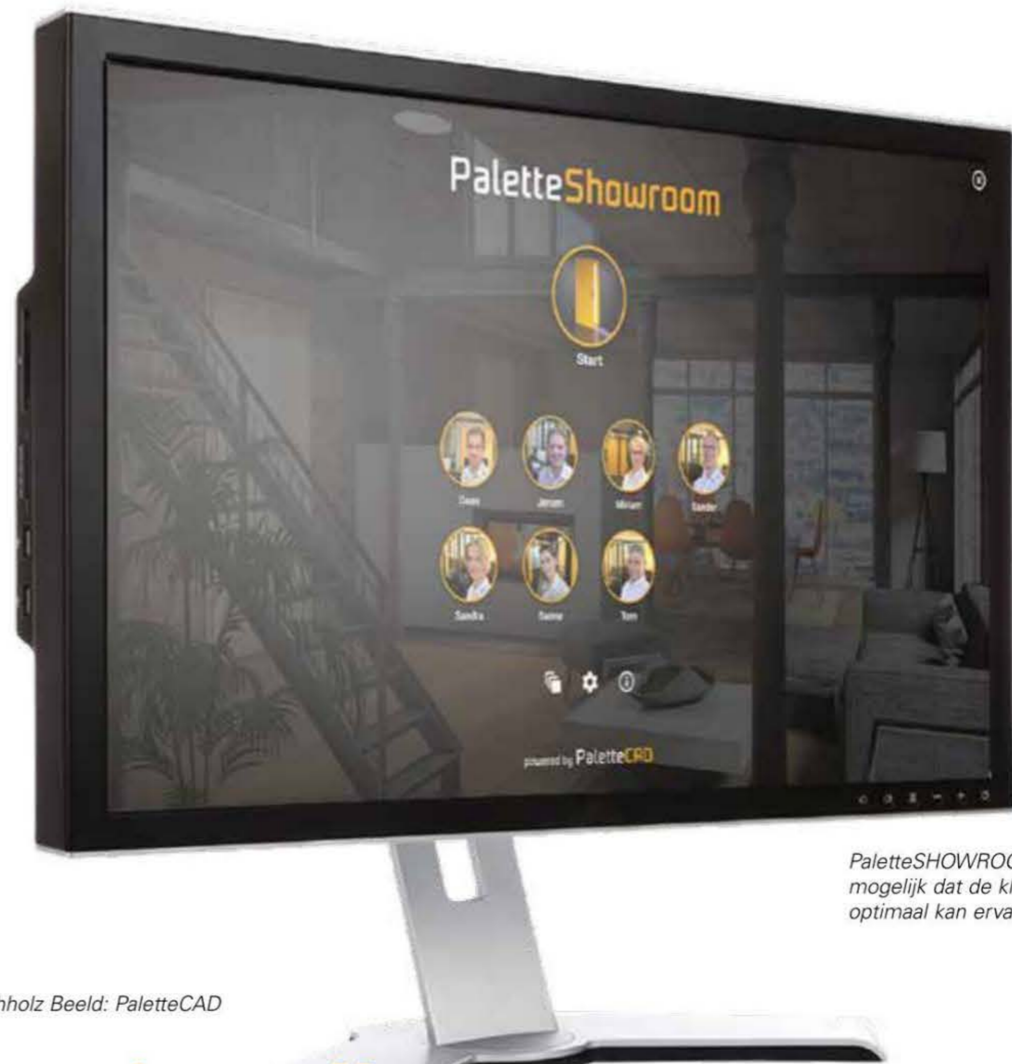
PaletteSHOWROOM Pro maakt het mogelijk dat de klant het ontwerp optimaal kan ervaren.