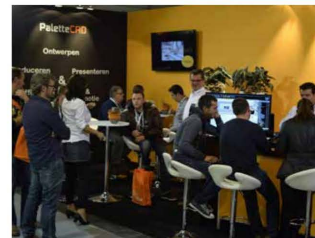
PaletteCAD op Prowood 2015.