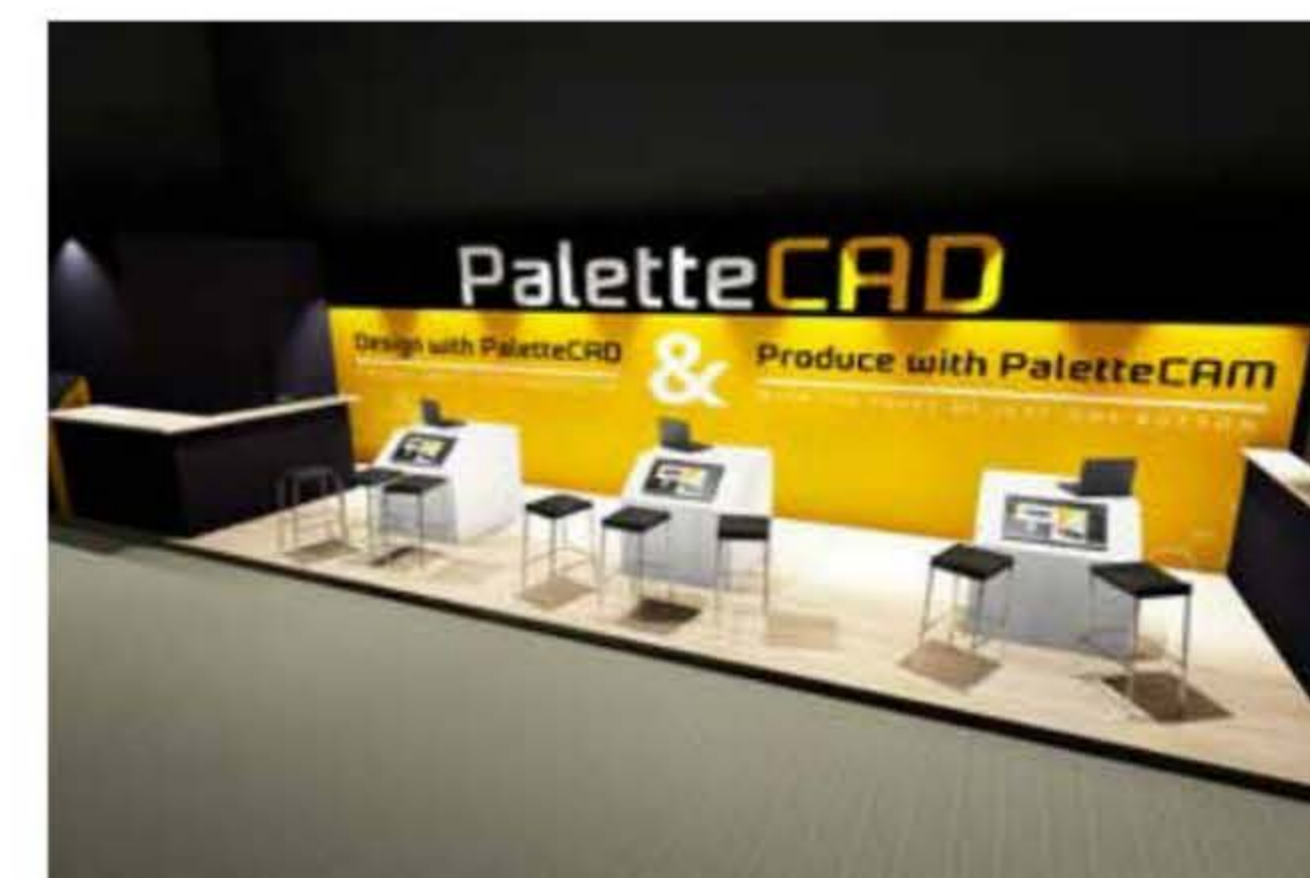
Standontwerp Prowood 2021.

Palettedcad is op Prowood te vinden op stand 4400 in hal 4, een centrale plek waar hal 1 en hal 4 bij elkaar komen. Schuin tegenover Palettedcad is FixChip te vinden in hal 1. ■