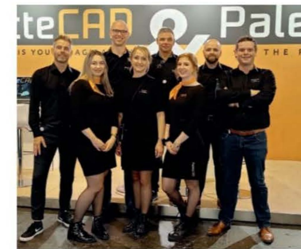
Het team van de softwarespecialist.

'ELKE KLANT WERKT ANDERS EN BIJ ONZE KLANTEN IS IEDERE SITUATIE OOK ANDERS'