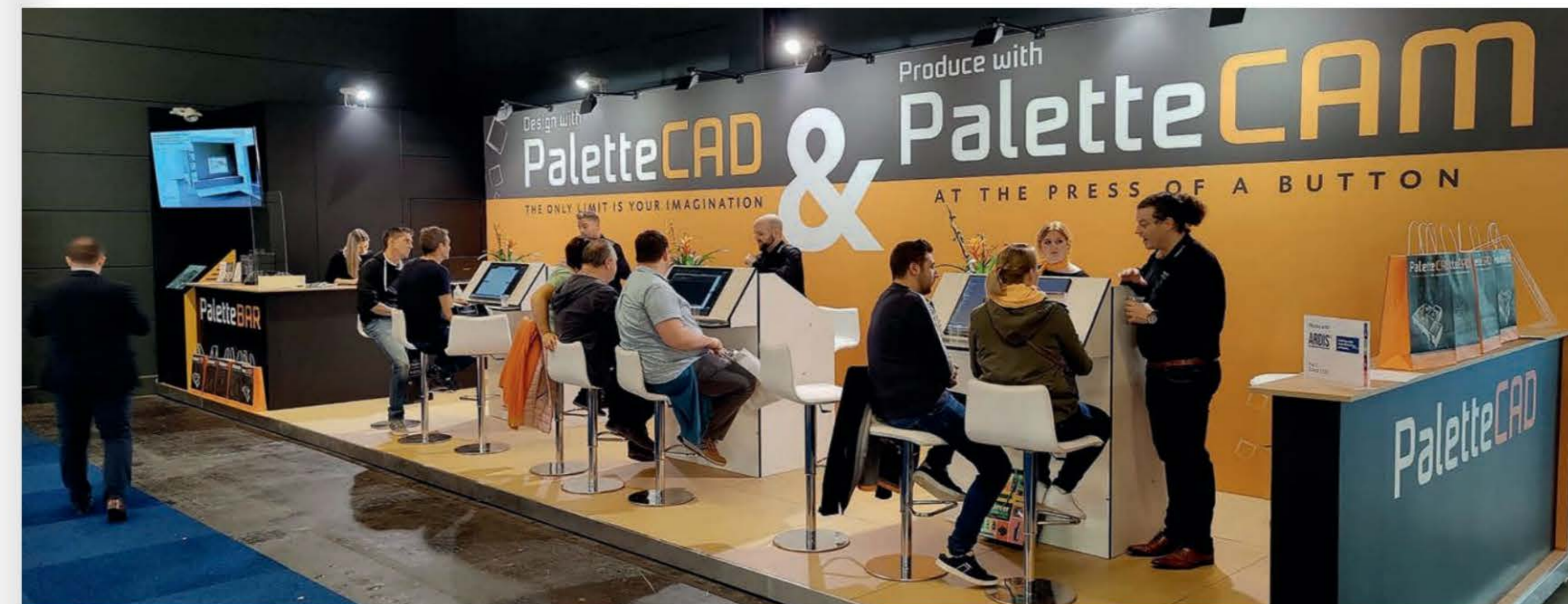
Dit jaar heeft PaletteCAD nog meer ruimte ter beschikking.