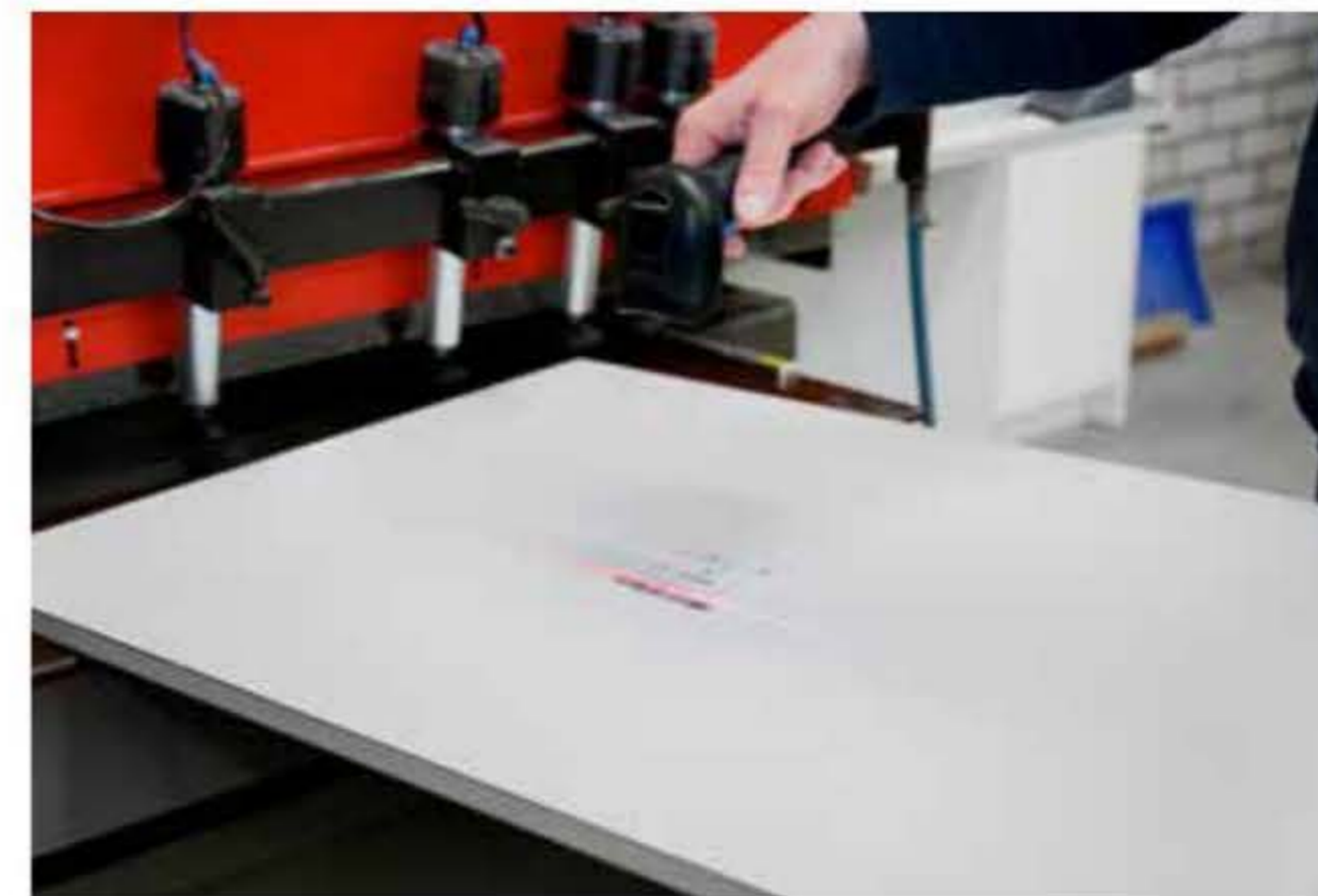
PaletteCAD kan een streepjescode genereren voor stickers/etiketten die een koppeling maakt met het juiste CNC programma.