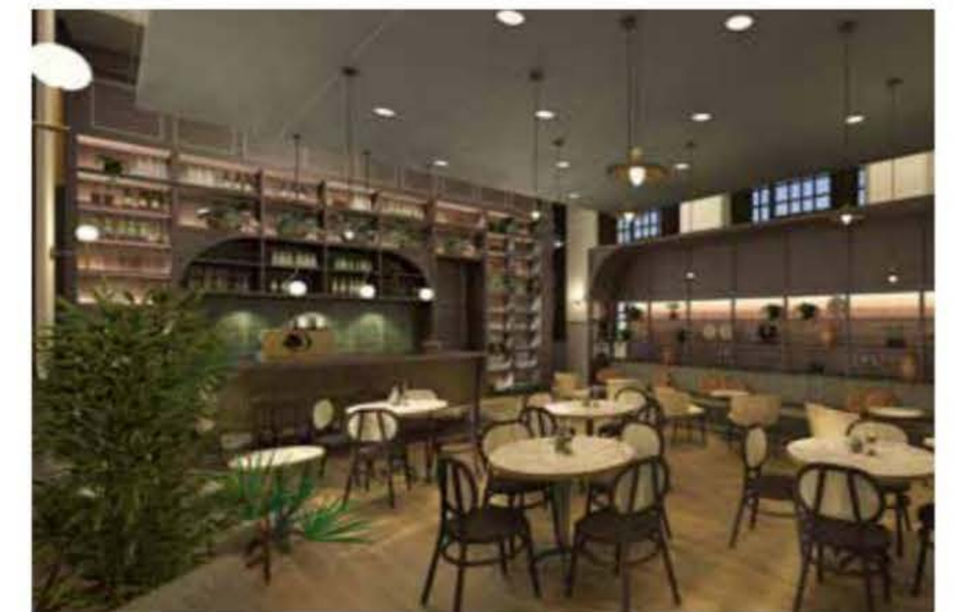
CLLTV verkoopt zijn ontwerpen met de visuele renders.