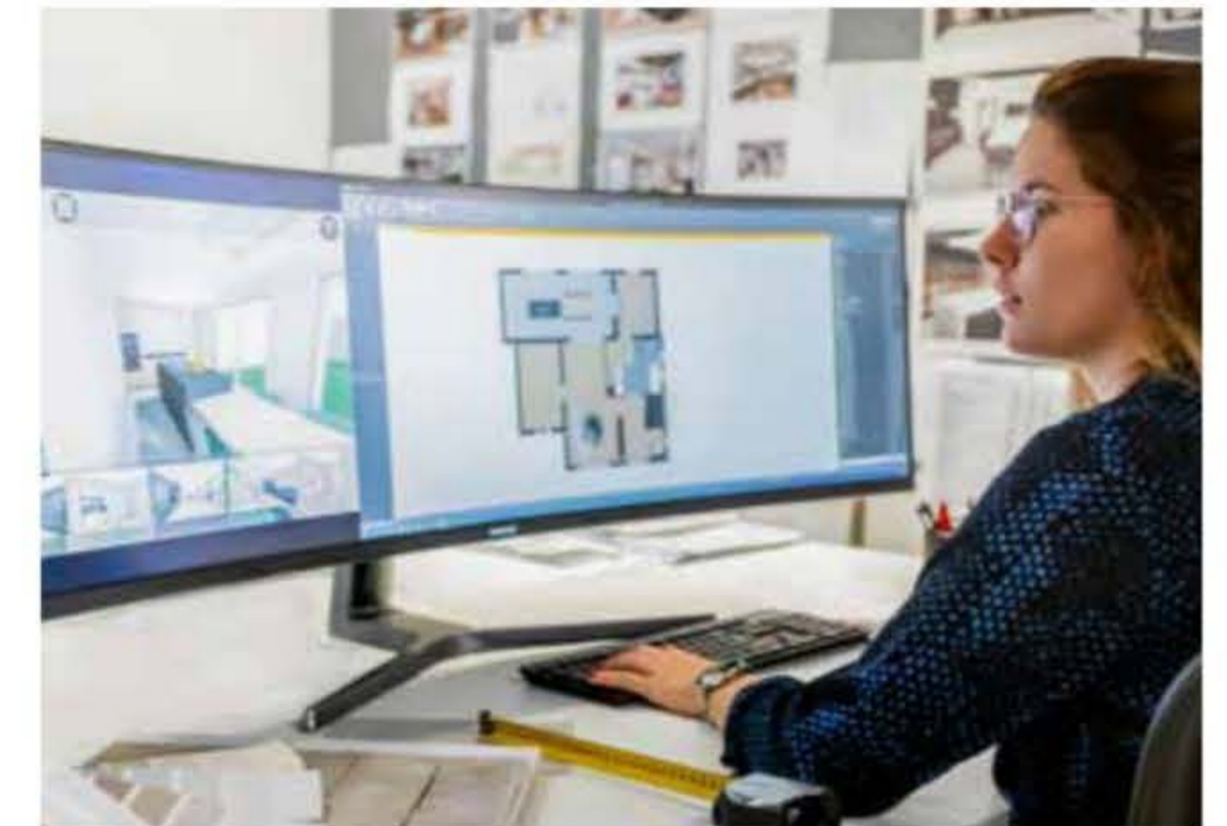
Bij CLLTV zijn acht mensen dagelijks bezig met tekenen.