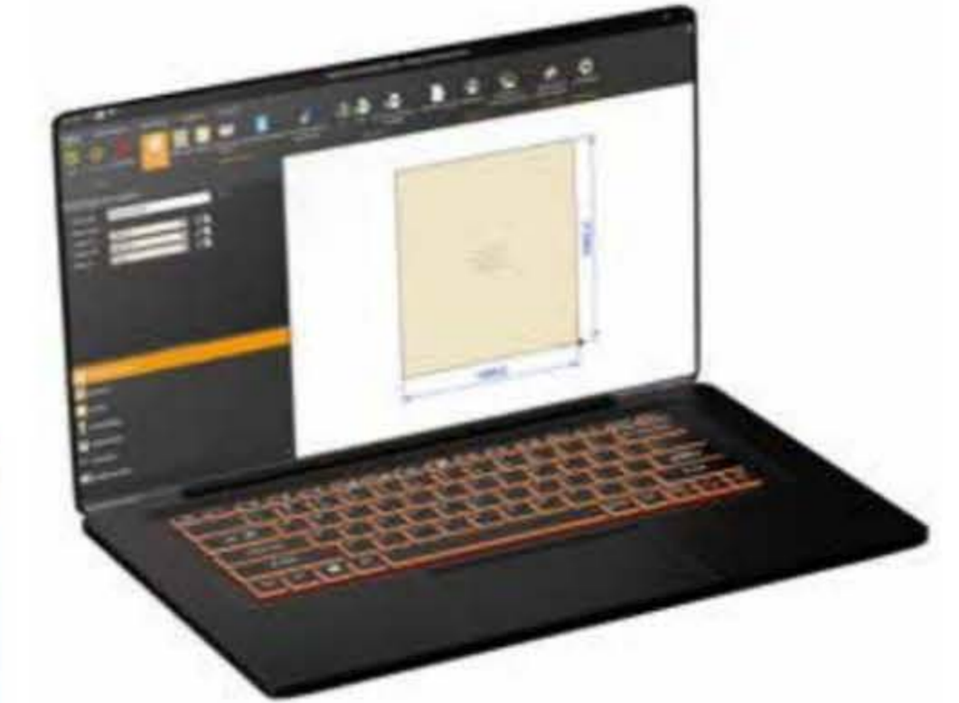
De nieuwe koppeling sluit beter aan op de nieuwe softwareprogramma's van deze tijd.

'WE HEBBEN DE NIEUWE VERSIE NU BIJ DRIE KLANTEN GEÏNSTALLEERD EN ZIJ ZIJN NET ZO POSITIEF ALS WIJ. DEZE ONTWIKKELING BIEDT ALLEEN MAAR VOORDELEN'