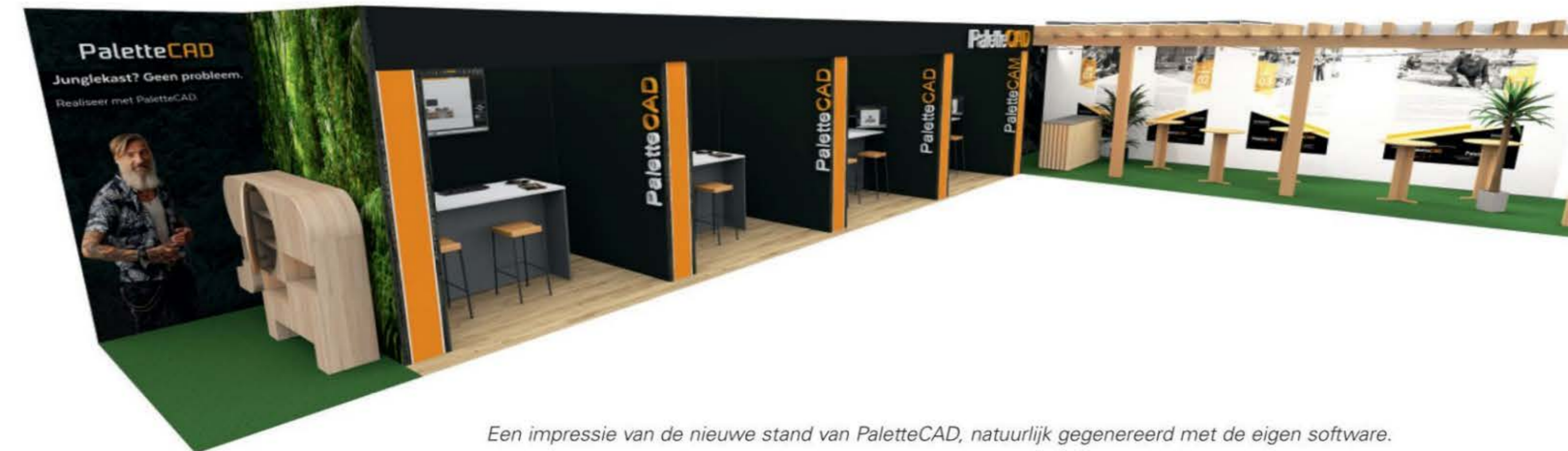
Een impressie van de nieuwe stand van PaletteCAD, natuurlijk gegenereerd met de eigen software.