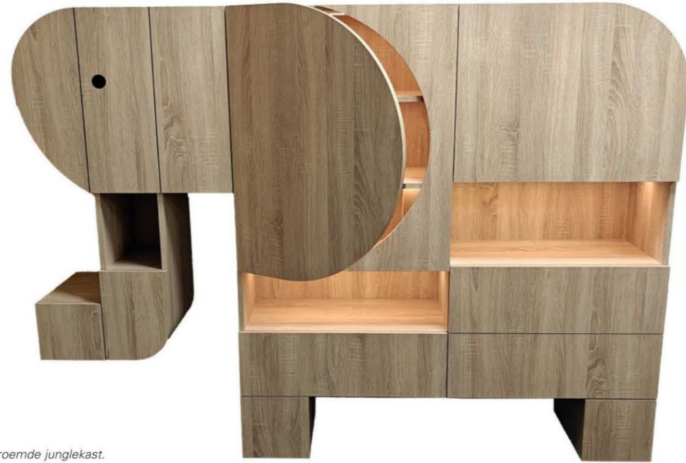
De beroemde junglekast.

Tekst: Tamara Brouwers